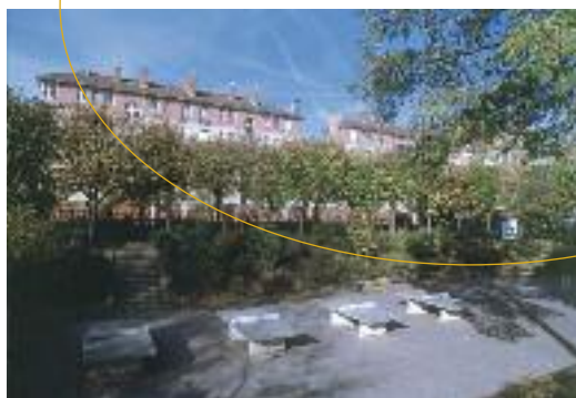
Square Léon Bourgeois

D ans la Cité-jardins, la nature est présente sous les formes les plus variées : au centre des principaux îlots, des places plantées d'arbres et tapissées de pelouses ainsi qu'un grand jardin public, permettent les jeux de plein air. Le square Léon Bourgeois de 10 200 m 2 est le véritable poumon vert de l'espace urbain.