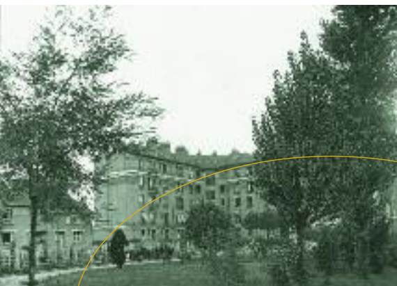
Espaces verts du 1 er îlot