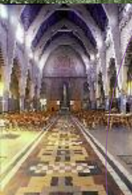
Eglise Notre-Dame de la Paix, vers 1940