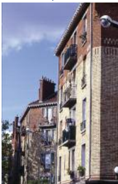
Façades des immeubles

A la fin de sa construction, la Cité-jardins compte alors 3297