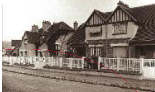
Pavillons individuels, vers 1935