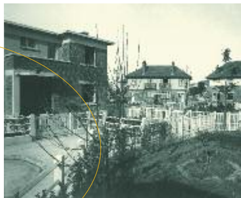
Pavillons et jardins

L es jardins individuels, espaces de devant et arrière des maisons, permettent aux occupants une appro-