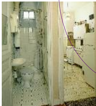
Appartement avec salle de douche et cabinet d'aisance jumelés, 1998

Mis en place par l'Office Public d'HBM (Habitations à Bon Marché), cet ensemble architectural novateur doit allier l'accueil du plus grand nombre (entre 8 000