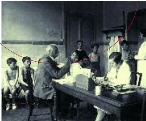
La visite médicale, vers 1930

scolaires de visites médicales régulières.